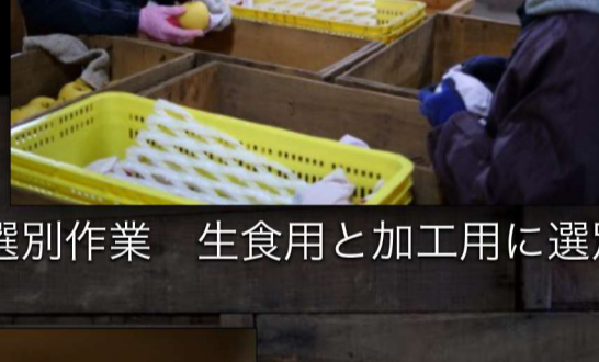
選別作業 生食用と加工用に選別する