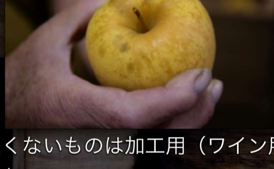
見た目が良くないものは加工用（ワイン用）となるが、風味は遜色ない